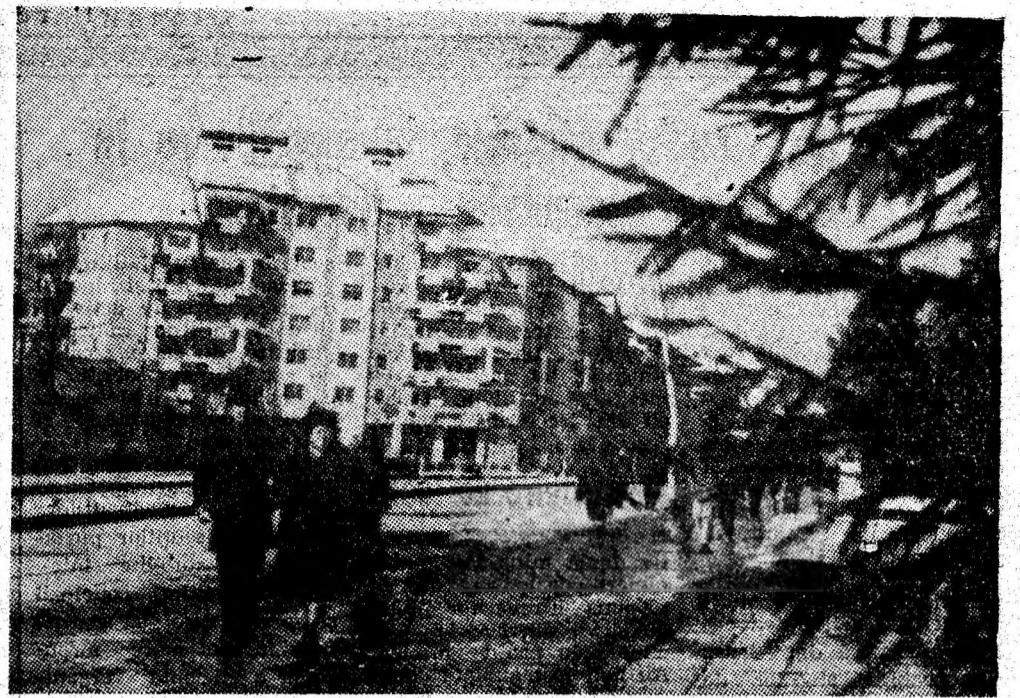
Petroșani-Nord. Crîmpei citadin.

onat de la unitățile mini- ere. Ceea ce ne-a reținut a- tenția au fost discuțiile pe marginea materialului prezentat. Reprezentanții