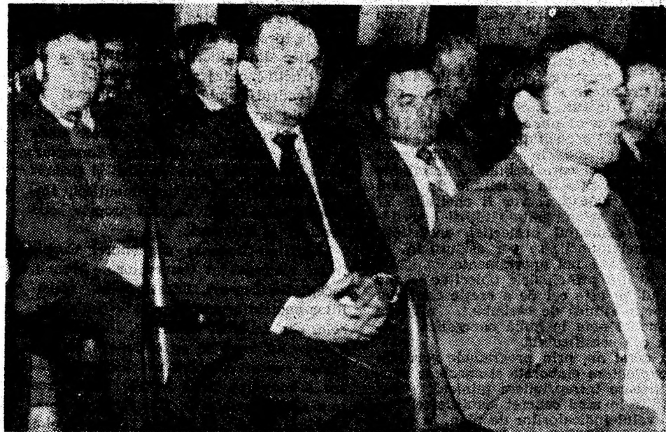
Aspect din timpul desfășurării lucrărilor.