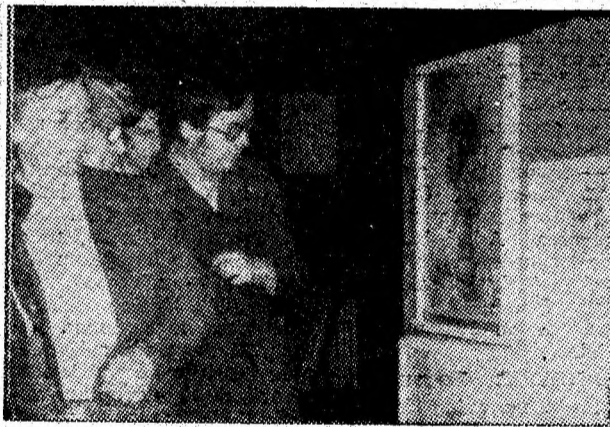
Expoziție a artiștilor plastici, din Petroșani, la Muzeul mineritului.