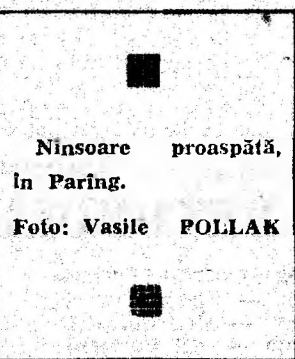
Ninsoare proaspătă, în Paring.