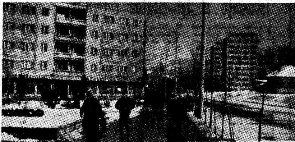
Crîmpei din împlinirile urbanistice ale Vulcanului.

autoaprovizionare. Acționînd în această direcție prioritară, vom acorda o atenție și mai mare problemelor de sistematizare, asigurînd locuitorilor, așa cum remarcă tovarășul Nicolae Ceaușescu, condiții tot mai bune de muncă și viață, asemănătoare mediului urban prin însăși calitatea vieții. Dezvoltarea și perfecționarea serviciilor pentru populație, realizarea unei activități culturale, de educație patriotică sînt direcții concrete de muncă ale consiliului popular comunal, înfăptuite cu participarea largă și activă a deputaților, a tuturor locuitorilor.