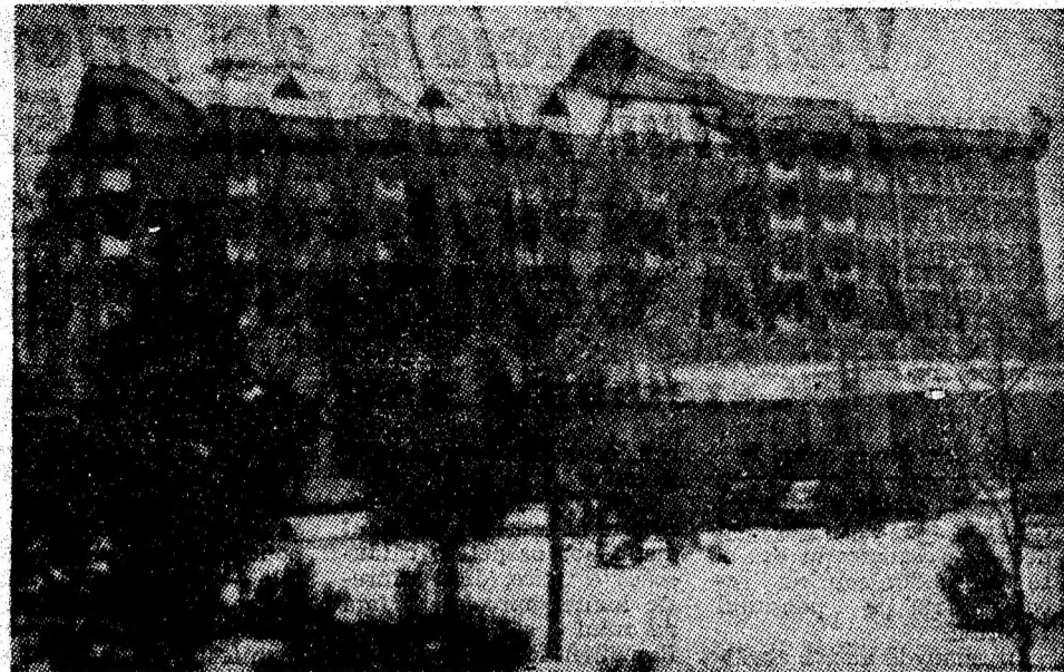
Seventă din Petroșani.

— Faptul că sectorul și-a îmbunătățit structura pe meserii, la nivelul brigăzilor din front. Faptul că familia noastră de mineri s-a mărit cu mulți tineri, dintre cei care au intrat, pentru prima oară, în subteran. Și ei, nou încadrații, pășesc, tot mai „minerește”, alături de „veteranii întru cărbune”, spre aceeași țintă comună.