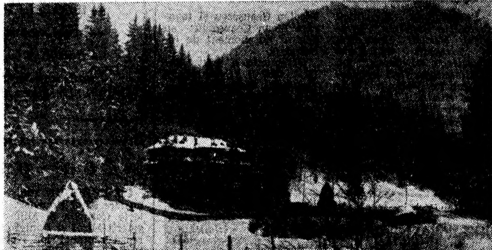
Valea Volevodului, un vechi și cunoscut bazin forestier. În centrul imaginii, cabana forestieră cu același nume.

brie 1987, apărarea și îmbunătățirea mediului înconjurător, conservarea și dezvoltarea fondului forestier se realizează prin limitarea tăierilor de masă lemnoasă, precum și prin creșterea ponderii pădurilor în unele zone cu climat mai puțin favorabil. De asemenea, în această acțiune de mare importanță economică se înscriu și asigurarea permanenței pădurii, realizarea unor structuri corespunzătoare sub raportul compoziției și densității arborilor la hectarul de pădure, precum și promovarea în cultură a speciilor autohtone valoroase. Alte măsuri privesc reducerea în circuitul economic, prin împădurire, a terenurilor degradate, sau în alunecare, paza pădurilor și protecția acestora, valorificarea superioară a fondului forestier și economisirea masei lemnoase. Este, de asemenea, necesar ca prin forme și mijloace specifice să educăm omenii muncii, în primul rând tineretul, în spiritul