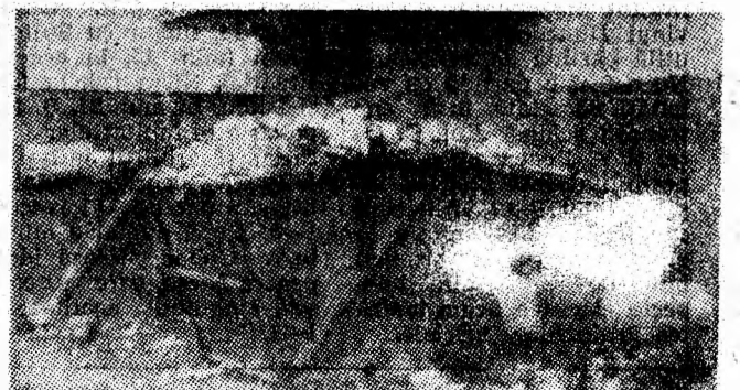
Cartierul Aeroport: Un „punct gospodăresc” care așteaptă lucrătorii de la salubritate.

Locatarii blocului 4, strada Venus, Petroșani