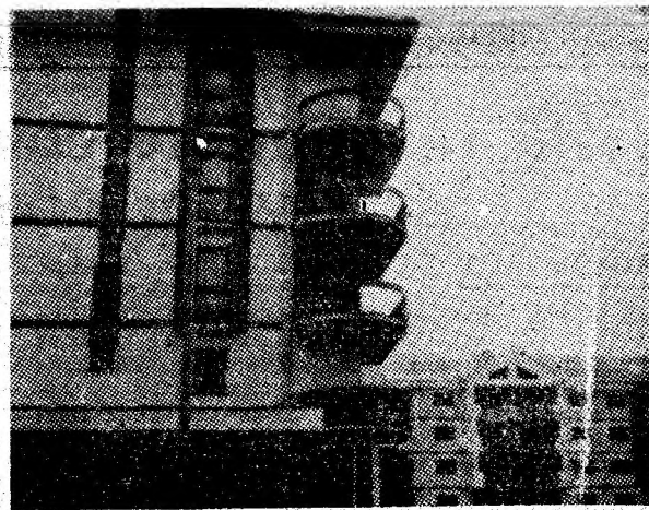
Úricani. Insemne ale noului în cartierul Bucura.