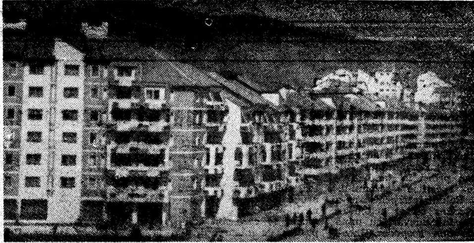
Cartierul Petrosani-Nord, expresie a innoirilor din reședința municipiului.