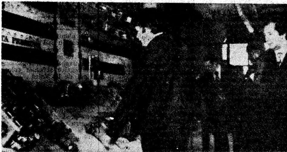
Secvență din schimbul de experiență de la IUMP.