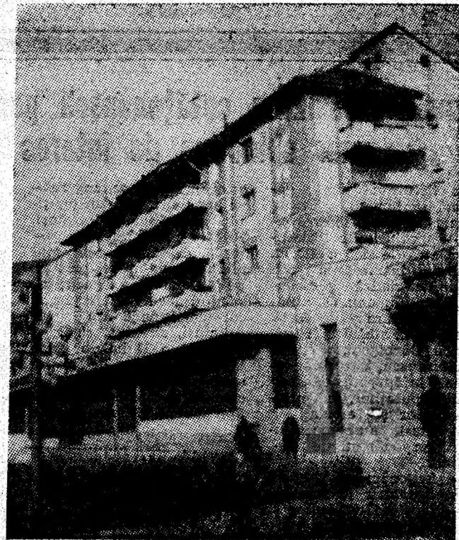
Arhitectură modernă în noul cartier Petroșani-Nord.