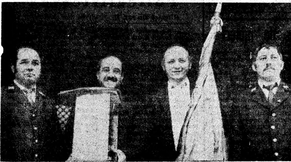
Reprezentanții minerilor de la Paroșeni, cărora li s-au închinat drapelul și trofeul de fruntași în întrecerea socialistă.