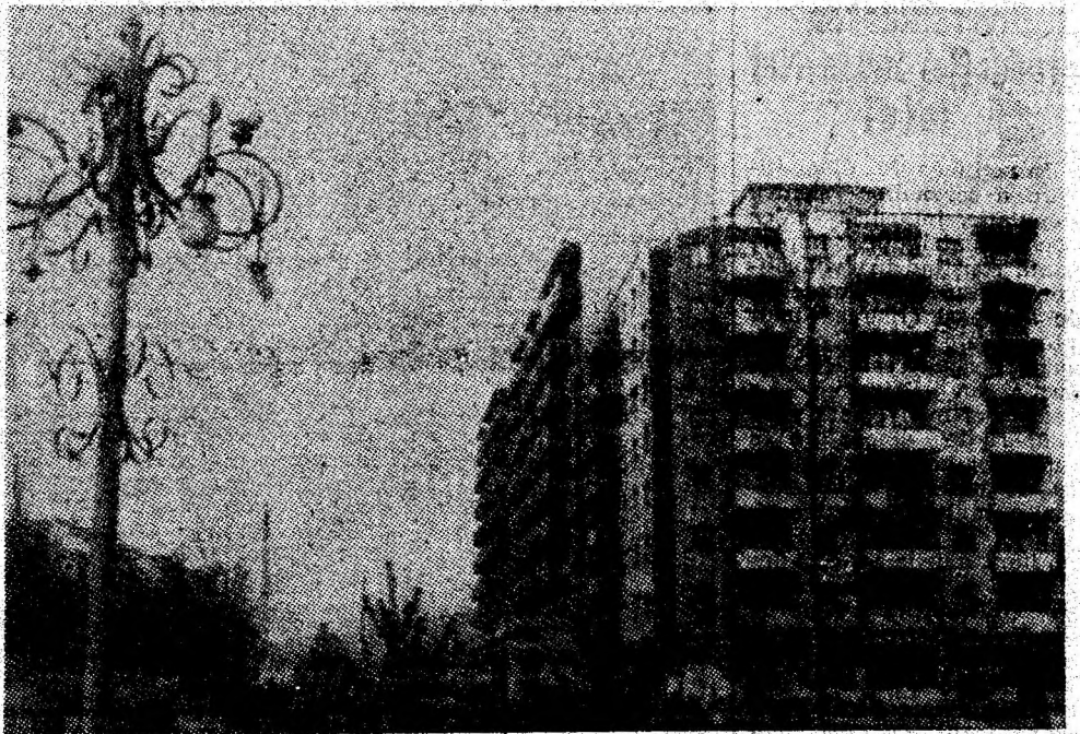
Vulcan. Valențele unui oraș aflat în continuă ascensiune edilitară.