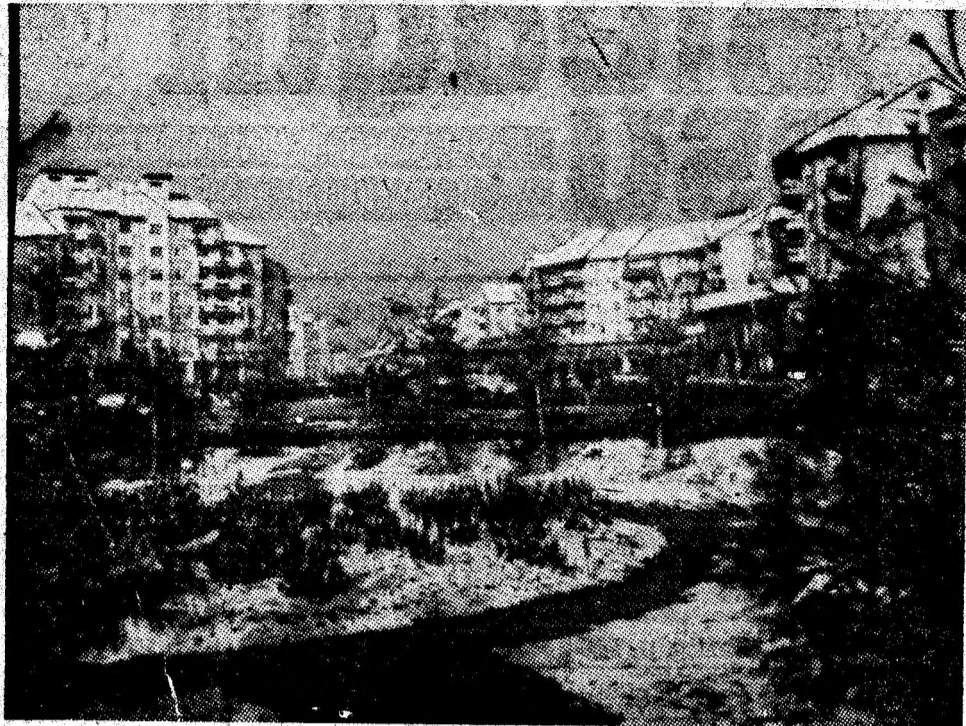
Petroșani-Nord. Secvență cu o ultimă răbufnire a iernii.