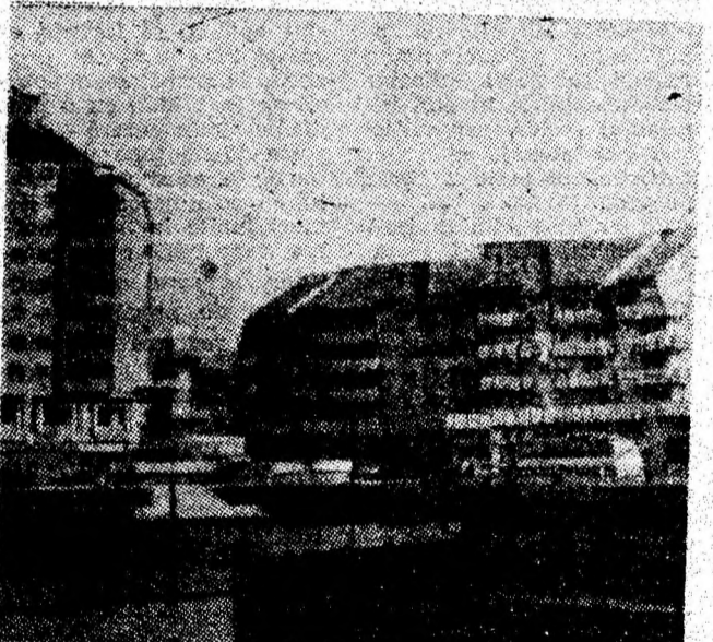
Petrosani-Nord, reprezentativă carte de vizită a reședinței de municipiu.

și tovarășul Nicolae Ceaușescu, a pus în evidență înalta apreciere, stima și prețuirea deosebită de care se bucură România socialistă, Partidul Comunist Român, activitatea revoluționară a conducătorului partidului și statului nostru, închinată fericirii poporului nostru, cauzei socialismului și păcii, a reliefat prietenia dintre partidele, țările și popoarele noastre.