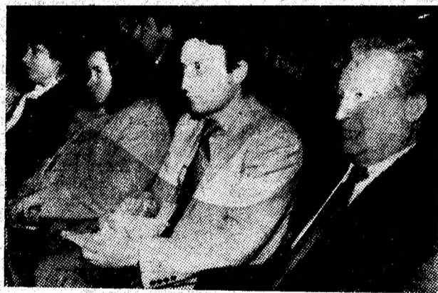
MEREU ÎN PREOCUPĂRI