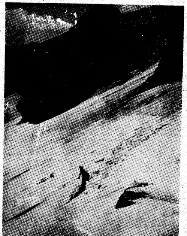
Vijelios, spre abisul căldării glaciare.