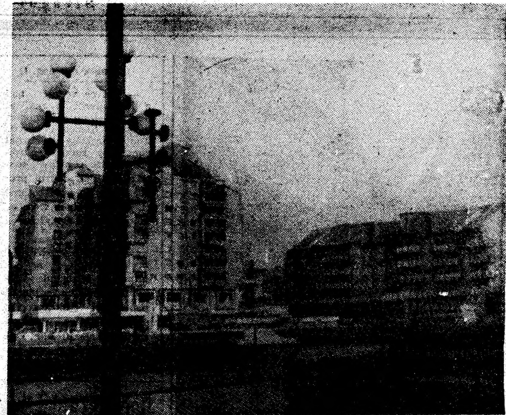
Valențe ale arhitectonicii moderne în reședința de municipiu.