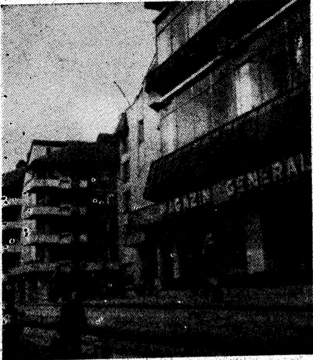
Petrița, oraș aflat pe coordonatele unei impetuase dezvoltări urbanistice.