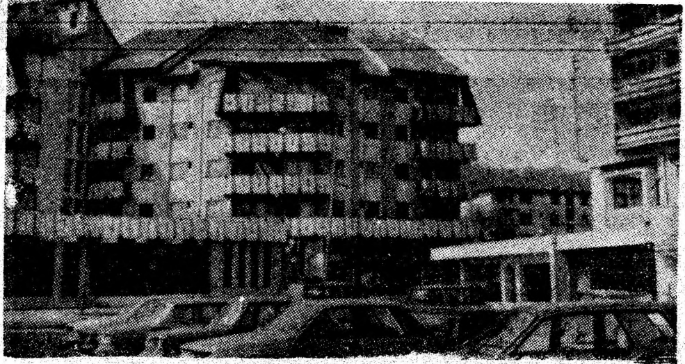
Petrosani-Nord, cartierul emblemă al reședinței noastre de municipiu.

— Ce influență au avut asupra activității de producție noile mori cu discuri și sfere montate în cursul anului trecut? — Mare. S-au îmbunătățit și au crescut mult indicii instalațiilor de preparare a prafului de cărbune. În acest fel, cantitatea de energie electrică produsă pe bază de cărbune a crescut în acest an cu peste 21 la sută fa-