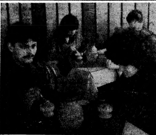
Aspect din noua unitate de cofetărie, deschisă recent în Vulcan, întregînd satisfacerea cerințelor populației.

N.R. Subscriem în totalitate acestor propuneri și așteptăm înfăptuirea lor. Sînt mai mult decît necesare!