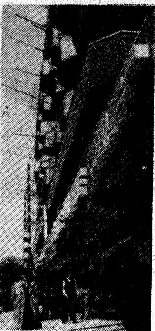
Tîmrețea și frumusețea orașului, elevată pe verticală.

muncitorești, la noi în sector, participarea muncitorilor, a oamenilor muncii la actul de conducere este o realitate inconfundabilă, vom asigura o și mai bună conlucrare și colaborare între toți factorii, în așa fel încît problemele de producție să fie soluționate cît mai operativ și mai eficient. Pornim în această acțiune de la teza exprimată de tovarășul Nicolae Ceaușescu, potrivit căreia problemele de producție se soluționează