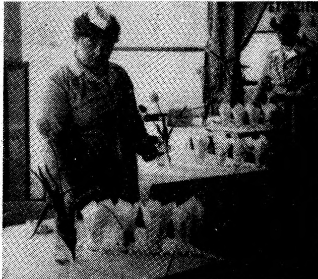
Unitatea nr. 155 — linie cu autoservire, recent deschisă în Uricani.

Tot luni, sala de apel a minei Lupeni a răsunat de cîntece aduse în semn de laudă muncii, de formația