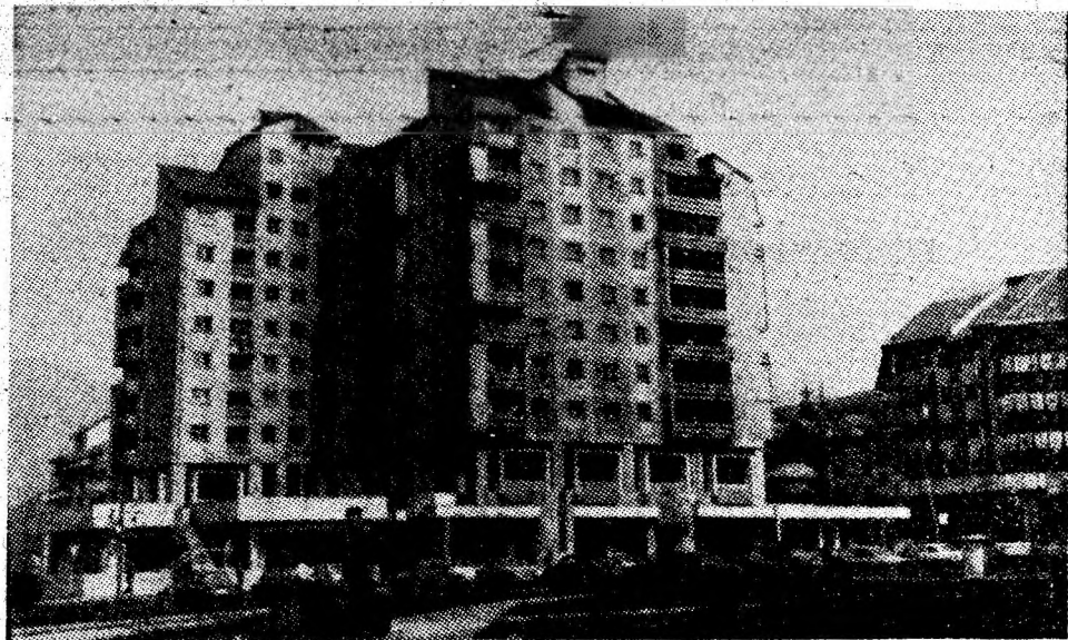
Efigii ale prezentului în reședința de municipiu.

— Aveați probleme și cu pompele de înaltă