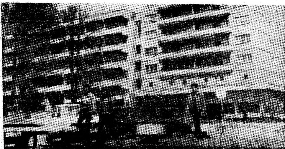
Imagine din Petroșani.

Orientările și ideile cuprinse în Expunerea tovarășului Nicolae Ceaușescu, din 29 aprilie, document programatic de excepțională însemnătate pentru perfecționarea întregii activități economico-sociale și dezvoltarea socialistă a patriei, reprezintă pentru noi, comunistii, întregul colectiv al minei Petrila, un amplu program de perfecționare a activității de conducere, de afirmare puter-