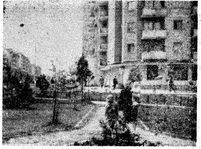
Vulcan. Secvență citadină.

Să înfăptuim exemplar sarcinile și indicațiile secretarului general al partidului, tovarășul NICOLAE CEAUȘESCU