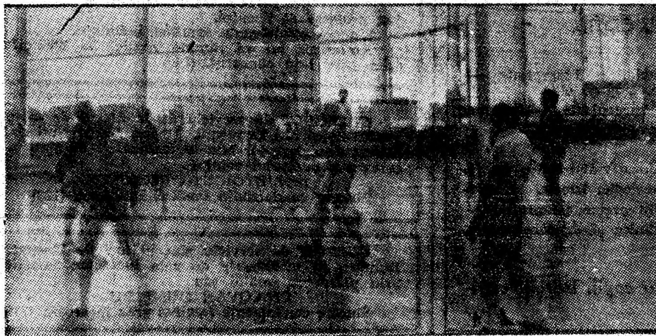
Prin promovarea în divizia B a echipei „Viitorul” IGCL Petroșani, iubitorii voleiului pot urmări din sezonul următor partide interesante, precum cea din imaginea alăturată.