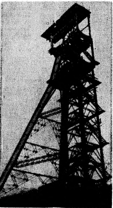
Translatarea turnului puțului Valea de Brazi.