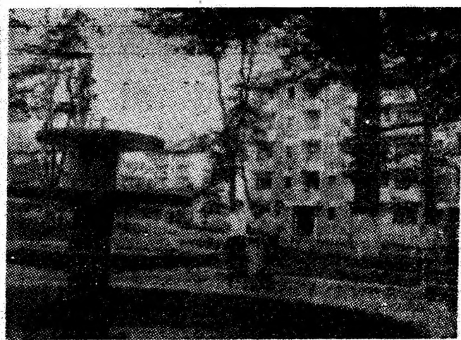
Vulcan — imagine din noul carfier „La Brazi”.

Să înfăptuim exemplar sarcinile și indicațiile tovarășului NICOLAE CEAUȘESCU