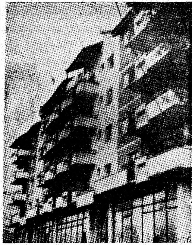
Petrila: Secvență urbanistică.