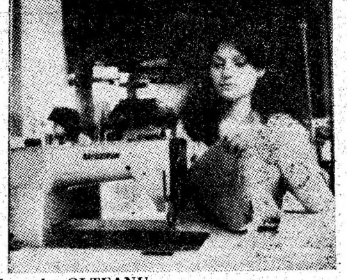
Imagini de muncă din mari unități economice ale orașului Vulcan.