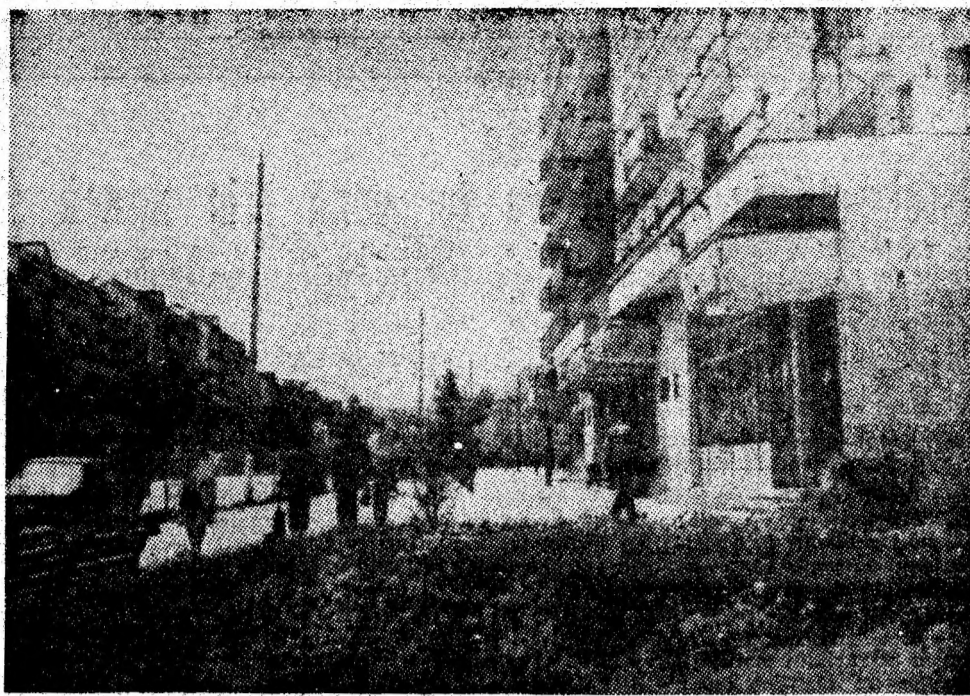
Vulcanul, sub soarele acestui iunie.