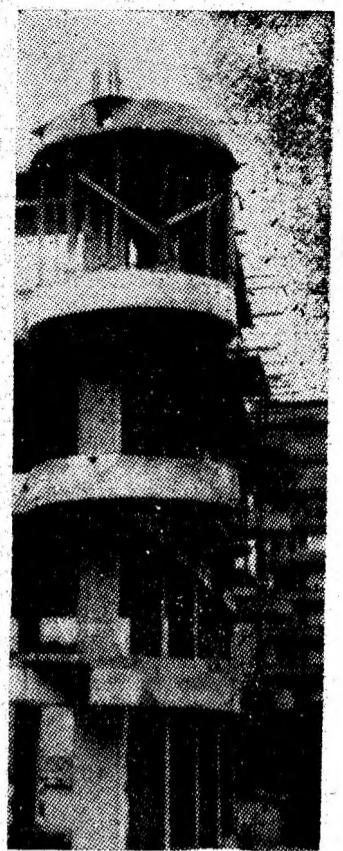
Armonii arhitectonice, la Lupeni.

rului general al partidului, privind revoluția română de la 1848 ca necesitate istorică obiectivă în înlăturarea idealurilor poporului nostru de libertate socială și națională, de independență și progres. Manifestarea a constituit un nou și semnificativ prilej, pentru participanți, de a da glas profundelor sentimente de dragoste față de patrie și partid, care îi animă pe toți cei ce trăiesc și muncesc în Valea Jiului, împreună cu hotărîrea lor nestrămutată de a face totul pentru a fi la înălțimea timpului eroic pe care îl trăim, răspunzînd astfel exigențelor pe care le impune mersul mereu ascendent al României, sub conducerea înțeleaptă a partidului, spre culmile luminoase ale comunismului.