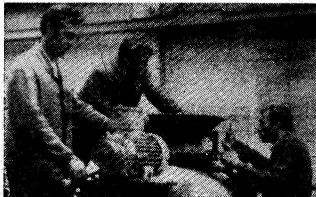
Aspect de muncă din secția „Service” a IPSRUEEM Petroșani.

— Ce măsuri concrete ați adoptat în această direcție?