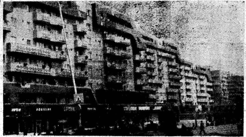
Cartierul Hermes din Petroșani.