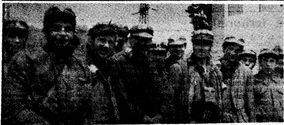
Mineri din sectorul III al I.M. Uricani, sector fruntaș al întreprinderii.