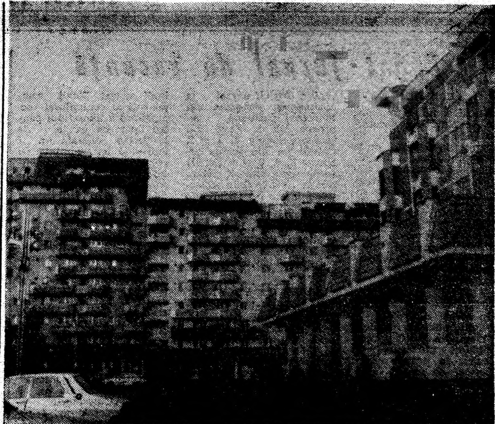
Petroșani. Vedere dinspre noul hotel.