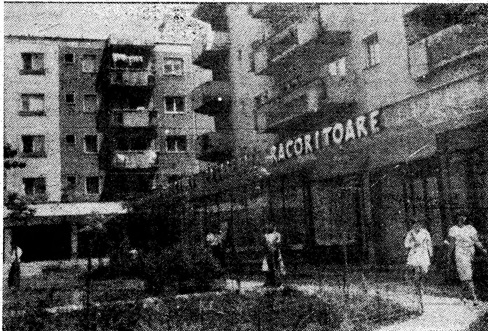
Petrila întinerită, cu edificiile și cartierele sale moderne, asigură locuitorilor orașului — minerii — condiții depline de confort.