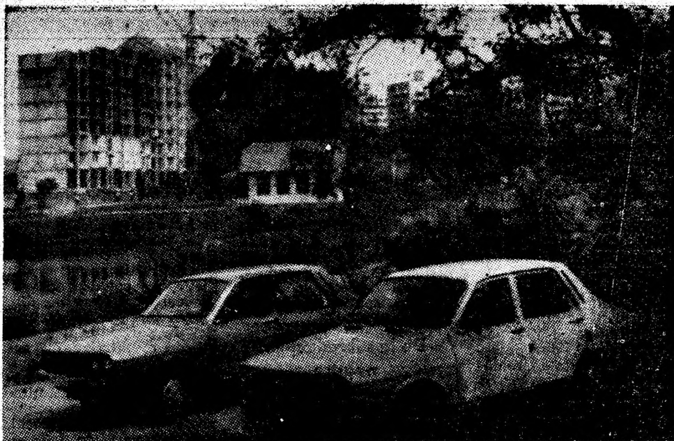
Un pitoresc colț din reședința de municipiu aflată în prefaceri înnoitoare.