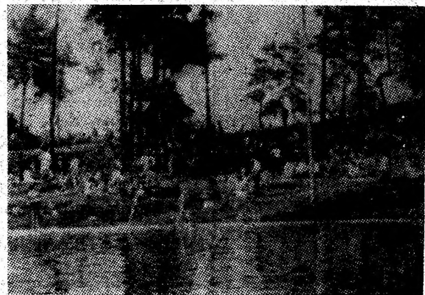
Duminică de duminică „Brădeț”, zona de agrement din Petroșani, atrage sute de oameni ai muncii. Așa a fost și de Ziua minerului, cînd, împreună cu familiile lor, minerii, cărora li s-au alăturat preparatorii, constructorii și constructorii de mașini, muncitorii din industria ușoară, alte categorii de oameni ai muncii au trăit o incintătoare zi de sărbătoare.