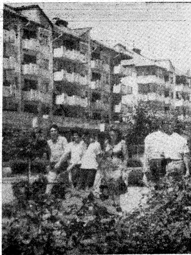
Secvență de vară, în Petroșani.

În întâmpinarea glorioasei aniversări a Eliberării patriei