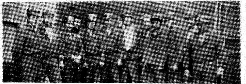
La terminarea lucrării, o fotografie de grup, o amintire plăcută în albumul întreprinderii. În foto cîțiva din specialiștii care au executat înlocuirea cablurilor, la I.M. Uricani.