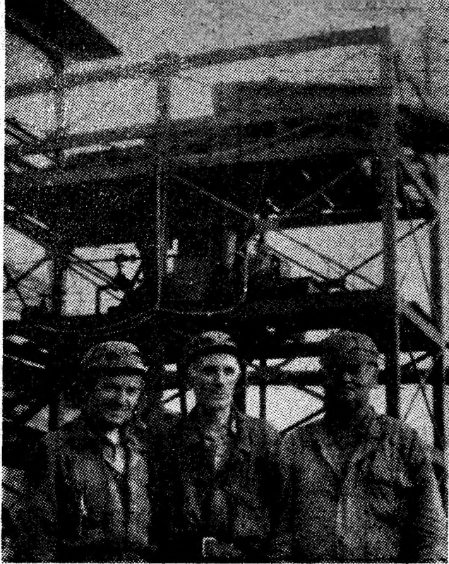
Noua stație de înnămolire de la I.M. Petrila-Sud și realizatorii ei.

Și în acest an, așezăminte de cultură din Valea Jiului — ne referim la cluburile muncitorești și la Casa de cultură a sindicatelor Petroșani — organizează numeroase cercuri tehnico-aplicative, menite să asigure oamenilor muncii posibilități de a-și cultiva aptitudinile în cele mai diverse domenii. La Casa de cultură a sindicatelor din Petroșani se primesc deja înscrierile pentru cercurile de dactilografie, stenografie, croitorie, depănare radio-TV, depănare auto, cosmetică, foto și cineclub, pian, flaut, chitară, vioară, fizică, matematică, limbi străine — franceză, engleză, germană. Clubul din Aninoasa reia, sperăm, cu același succes ca în anul trecut, cercurile de tehnică minieră și broderie-croitorie. Cluburile muncitorești Petrila, Loneca, Vulcan, Lupeni și Uricani oferă, de asemenea, posibilități de a urma cursurile unor cercuri tehnico-aplicative. (A.I.H.)