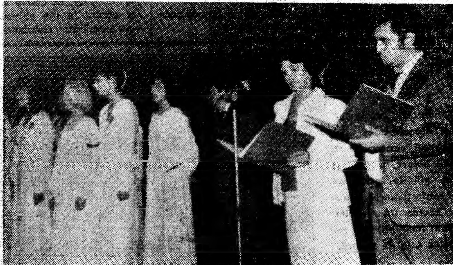
Aspect din spectacolul festiv dedicat zilei de 23 August.