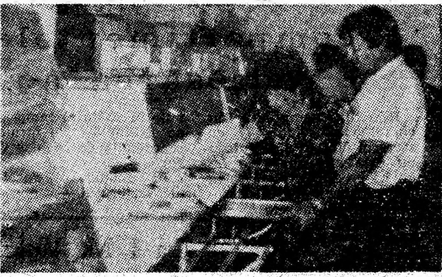
Linia de autoservire „Minerul”.