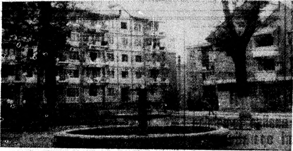
Un modern cartier își etalează satba blocurilor de locuințe: „La Brazi” din Vulcan.