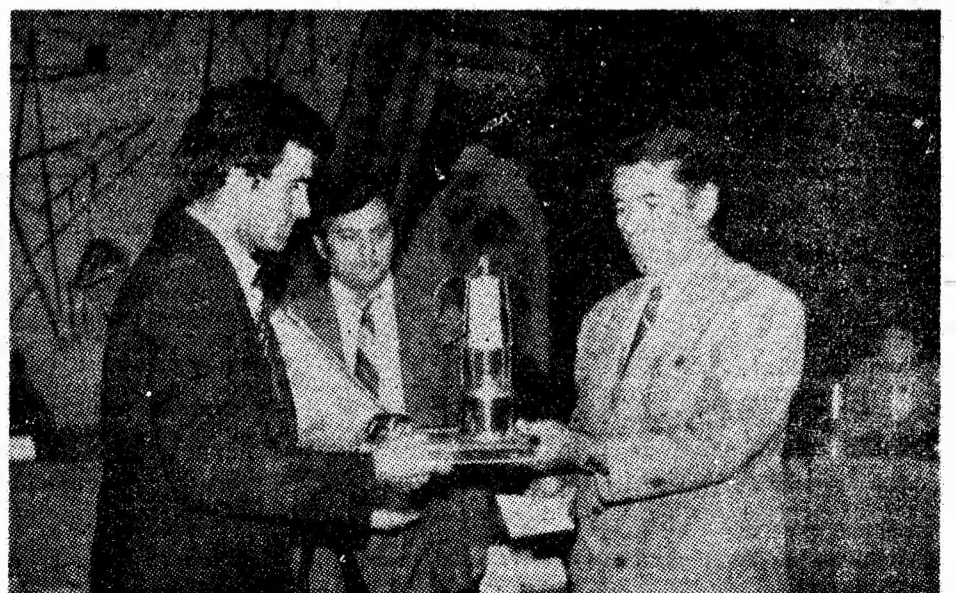
Înmînarea premiului „Trofeul minerului” — 1988.