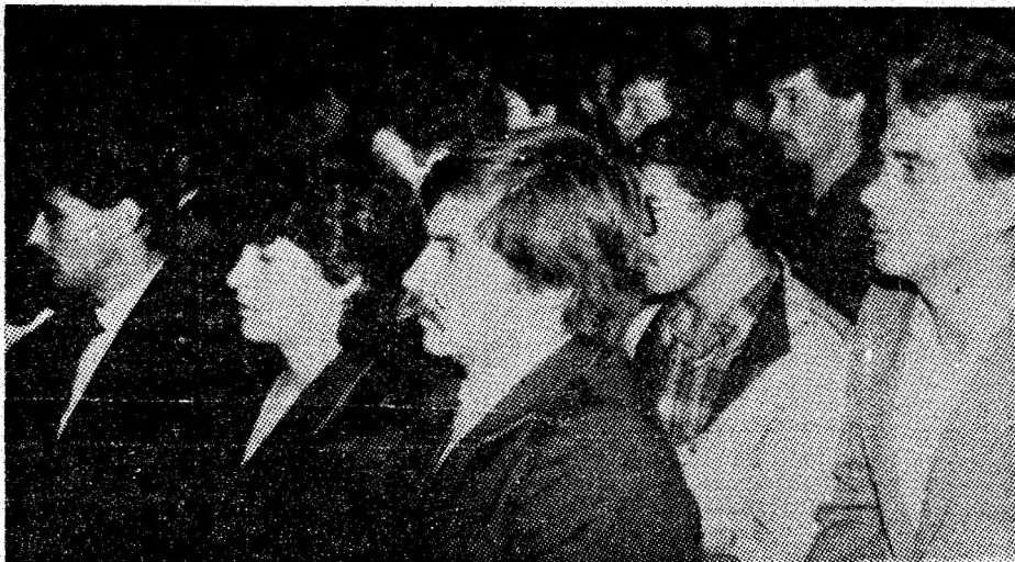
Aspect din aula Institutului de Mine din Petroșani.