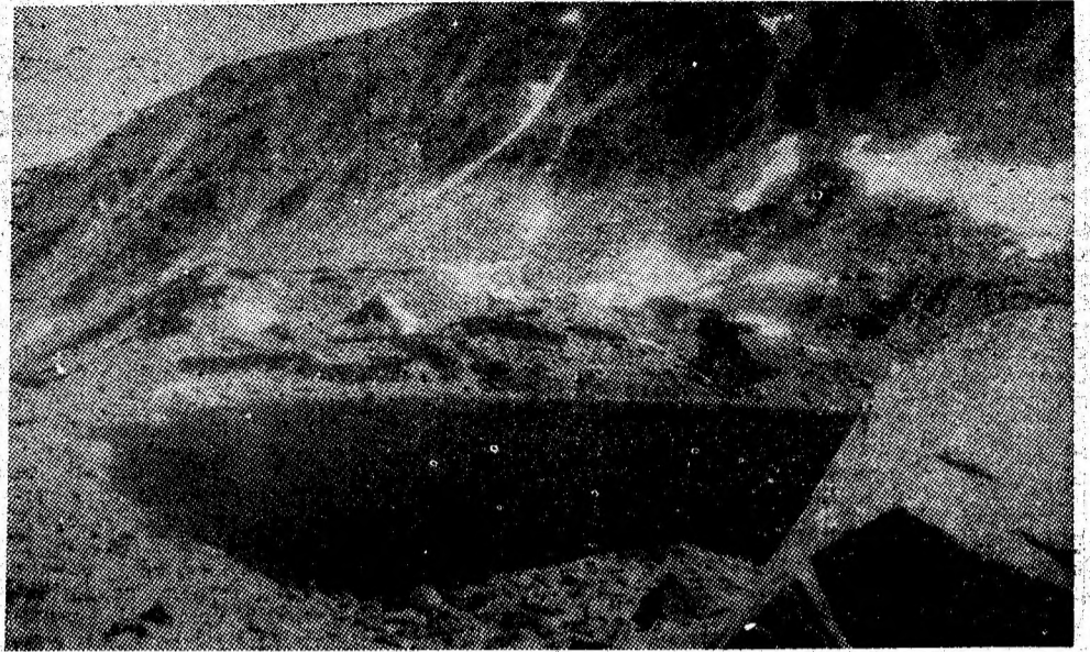
Geometrie în jurul lacului Roșiile-Paring.