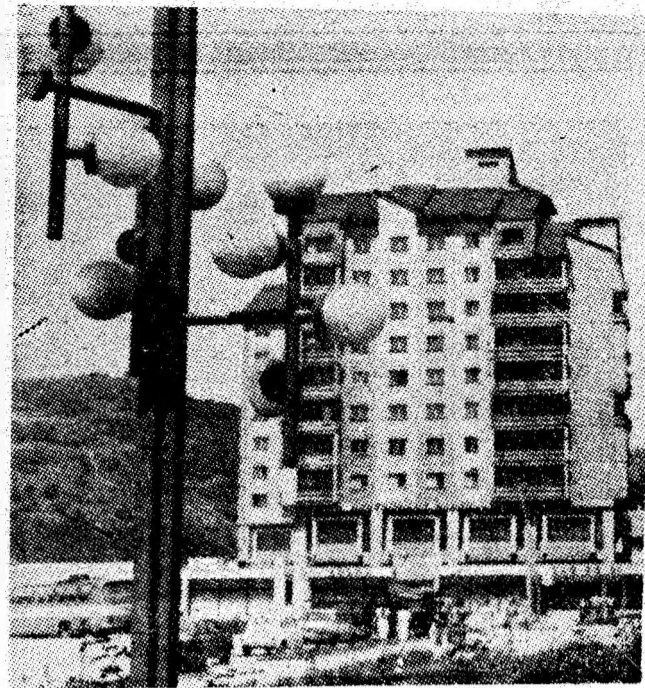
Pentru proaspătul sosit în reședința de municipiu, noile blocuri de locuințe, cu arhitectonica lor modernă, reprezintă o veritabilă carte de vizită.

Colectivul de muncă al I. M. Lonea și-a realizat planul pe nouă luni