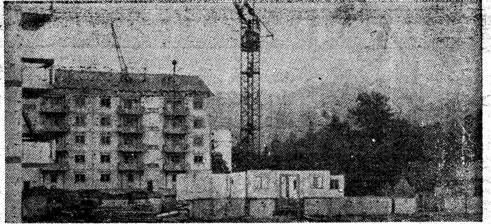
Lingă pîriul Sălătruc, se înalță noi și moderne blocuri de locuințe ce vor completa cartierul Aeroport.