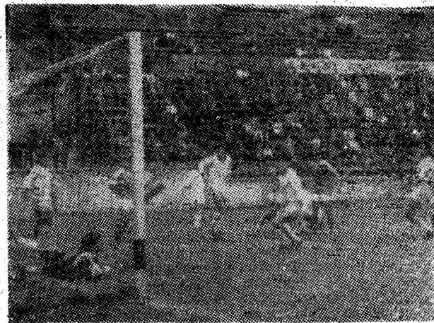
Pe tot parcursul celor 90 minute de joc, nici una din fazele inițiate de jucătorii de la Paroșeni n-a fost fructificată pe tabela de marcaj.

După evoluția din teren, se poate totuși afirma că meciul a aparținut gazdelor. Dar nu ajunge ca cel puțin 80 de minute din timpul total de joc să evolueze în jumătatea de teren a echipei oaspete. Nu ajunge să se facă risipă de energie, să se asalteze cu întreaga echipă careul