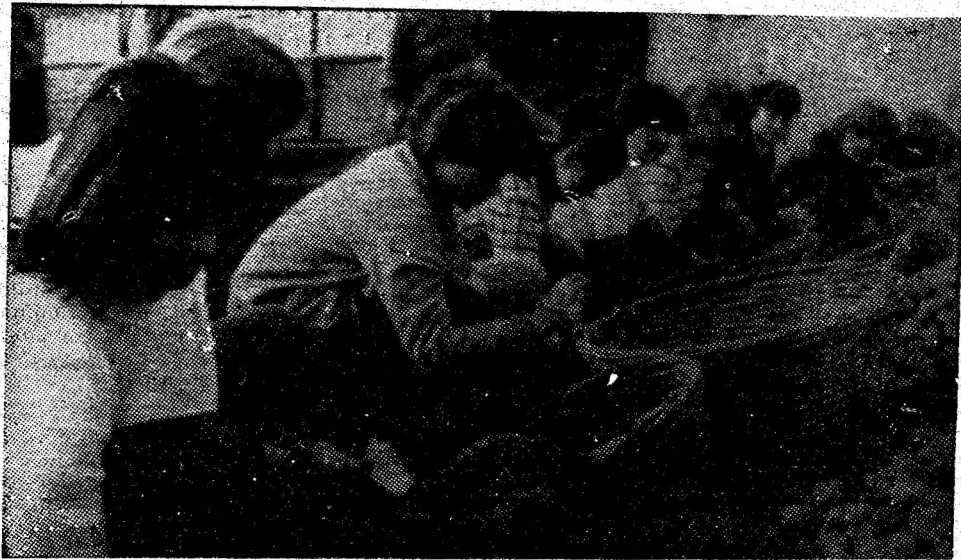
Eleve de la Liceul economic și de drept administrativ din Petroșani ajutînd la acțiunea de sortare și însilozare a cartofilor, la depozitul din Isroni.