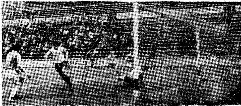
Atacul AS Poroșeni Vulcan se pare că a găsit drumul cel bun.