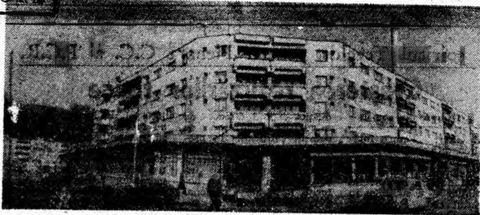
Secvență panoramică din noul centru civic al orașului Lupeni, înscris pregnant pe coordonatele dezvoltării urbanistice.

Să înfăptuim exemplar sarcinile și indicațiile tovarășului NICOLAE CEAUȘESCU