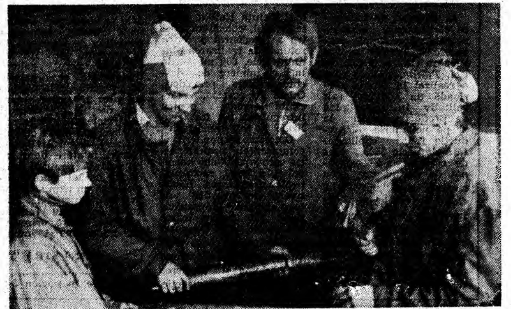
În atelierul mecanic al școlii, elevii clasei a IX-a, de la Liceul Industrial minier Vulcan, execută distanțiere TH, destinate minel din localitate.

cît activitatea politico-ideologică de formare a conștiinței revoluționare, a omului nou să devină o forță mai puternică, să se transforme, dacă se poate spune așa, într-o adevărată forță motrice a înaintării întregului nostru popor pe calea socialismului și comunismului”, toate forțele creatoare din municipiul minerilor acționează sub marea emblemă a Festivalului național „Cîntarea României”, pentru creșterea substanțială a calității actului cultural. Prezențe remarcabile în mijlocul propriilor colective de muncă, animatorii culturali, formațiile artistice, cercetătorii științifici care sînt în prezent angrenați în etapa orășenească a festivalului, fac totul pentru a conferi, fiecărei manifestări, valențele unui act de cultură și educație. În acest spirit se desfășoară în Valea Jiului spectacolele, expozițiile, celelalte acțiuni culturale-științifice cuprinse în etapa orășenească a festivalului, fiecare dintre ele constituind o tribună a ideilor înaintate, a culturii larg democratice, socialiste.