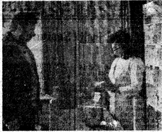
Aspect din unitatea nr. 2 „Plafar” din Petroșani.