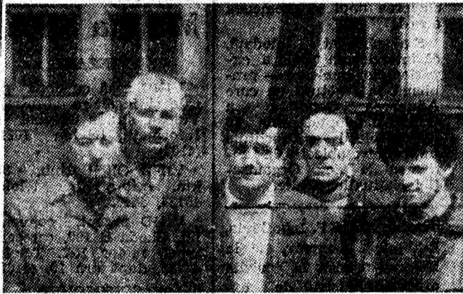
Compenții ai formației electromecanice nr. 3.

— Toate vizează același scop: cât mai mult cărbune special ! Și ele înseamnă toate aspectele activității noastre: de la asigurarea preluării ritmice a producției livrate de mineri, până la mărirea orelor de funcționare a instalațiilor noastre, de la organizarea optimă a expediției cărbunelui către beneficiari, până la menținerea parametrilor optimi în punctele cheie ale fluxului de spălare. Sintem conștienți cu toții de faptul că rezultatele mai bune din ultima perioadă nu sînt decît primii pași pe un drum pe care s-a angajat întregul colectiv de preparatori de la Petrila.