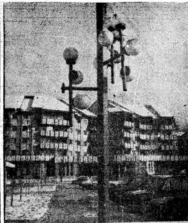
Instantaneu de noiembrie în Petroșani Nord.