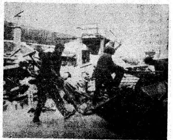
Aspect de la acțiunea de colectare a fierului vechi la I.M. Dilja.