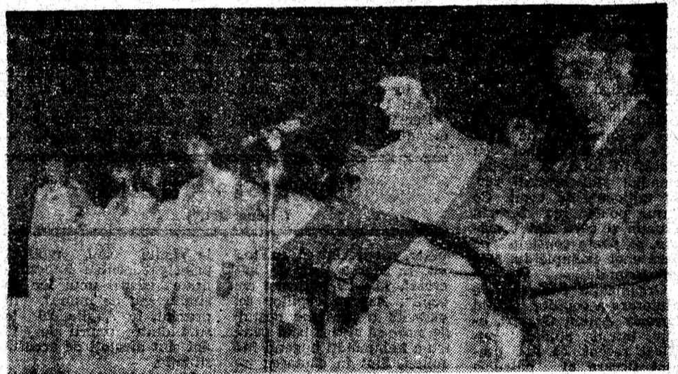
Aspect din spectacolul festiv desfășurat recent, la Petroșani, pe scena Teatrului de stat „Valea Jiului” și dedicat zilei de 1 Decembrie.