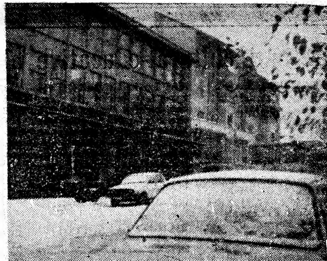
Secvență de iarnă în Petrosani.